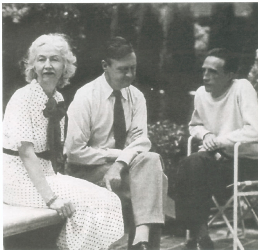
Lousie e Walter Arensberg con Marcel Duchamp, Hollywood, California, 17 agosto 1936, © Beatrice Wood