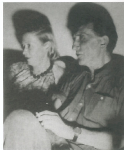
Teeny e Marcel, Cadaquès, 1964 circa, anonimo © Succession Marcel Duchamp, by SIAE 2009